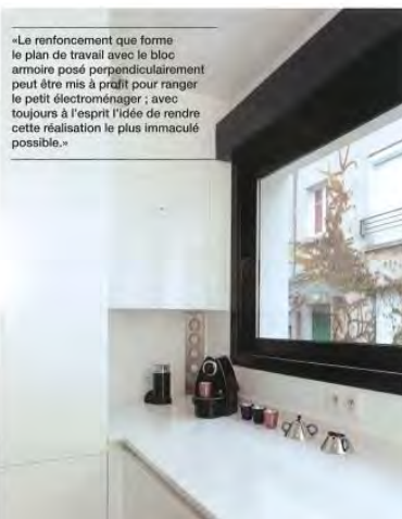
«Le renforcement que forme le plan de travail avec le bloc armoire posé perpendiculairement peut être mis à profit pour ranger le petit électroménager : avec toujours à l'esprit l'idée de rendre cette réalisation la plus immaculée possible.»

Conception et réalisation de la cuisine, Total Consortium Clayton/Régis Van Puyvelde . Cuisine LineaQuattro