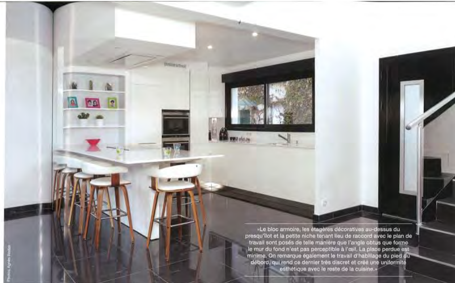
«Le bloc armoire, les étagères décoratives au-dessus du presque îlot et la petite niche tenant lieu de raccord avec le plan de travail sont posés de telle manière que l'angle obtus que forme le mur du fond n'est pas perceptible à l'œil. La place perdue est minime. On remarque également le travail d'habillage du pied du débord, qui rend ce dernier très discret et crée une uniformité esthétique avec le reste de la cuisine.»

Dans cette maison neuve, les clients exigeaient du cuisiniste une réalisation légère, épurée, et qui fusionne parfaitement avec le salon sur lequel elle donne. Plus facile à dire qu'à faire dans ce volume où l'un des murs est de biais, mais mission accomplie !